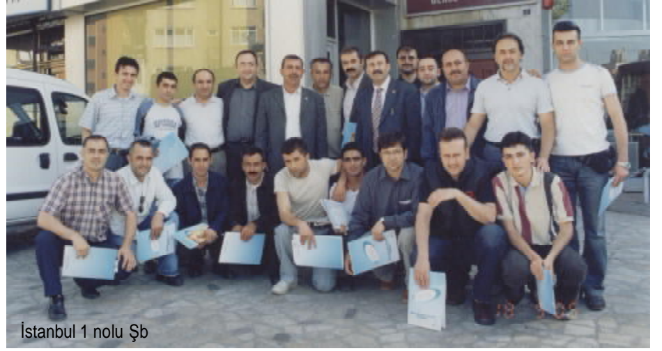
İstanbul 1 nolu Şb

İzmir Şubemiz ise önceliği elbette kitlesel grev eğitimlerine verdi.