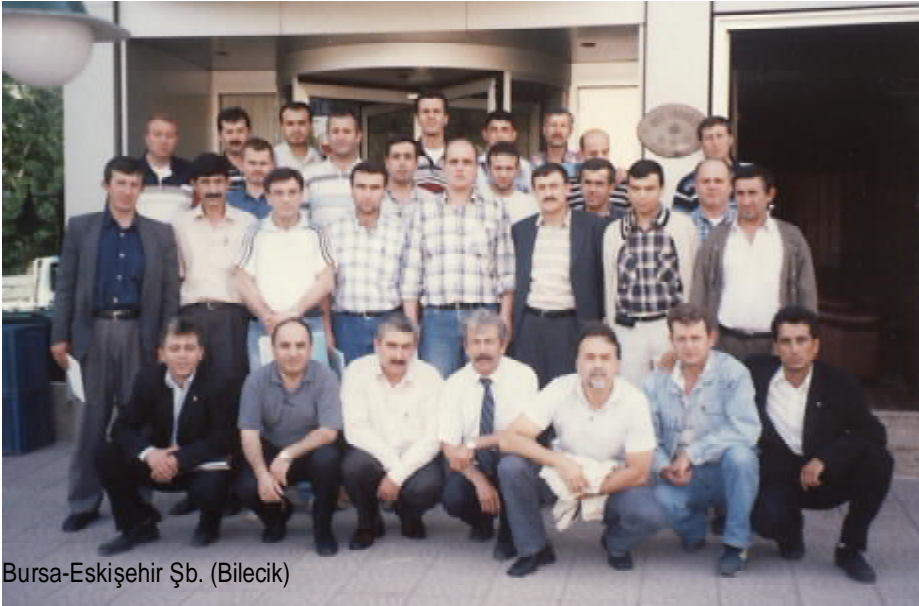
Bursa-Eskişehir Şb. (Bilecik)