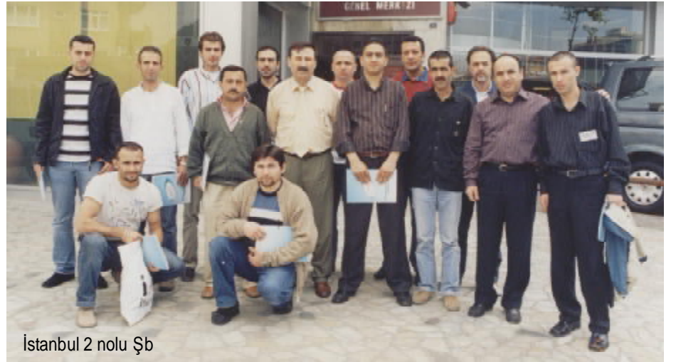
İstanbul 2 nolu Şb