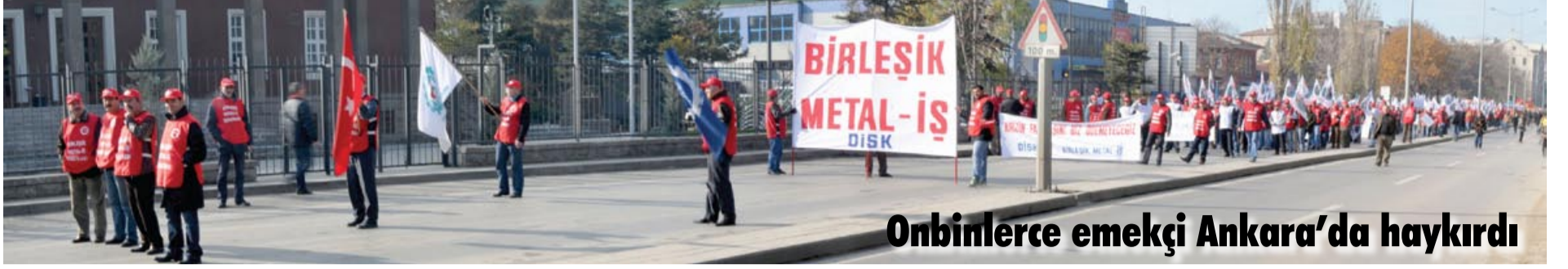
Onbinlerce emekçi Ankara'da haykırdı