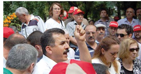
Kemal Türkler için, Gönen Kemal Türkler Eğitim ve Dinlenme Tesislerimizde de bir anma töreni düzenlendi.