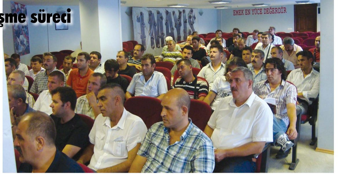
24 Temmuz 2010 tarihinde, Merkez TİS Komisyonumuz Genel Merkezimizde toplandı

Sendikamıza üye olsun olmasın bütün metal işçilerini ortak taleplerimiz için ortak mücadeleye çağırıyoruz.