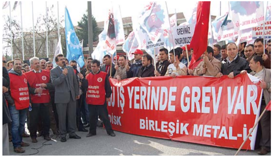
Gebze Şubemize bağlı Arfesan işyerinde, 8 Nisan'da başlayan grev 7 gün va-rılan anlaşma ile sona erdi....