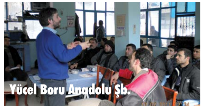
Yücel Boru Anadolu Şb.