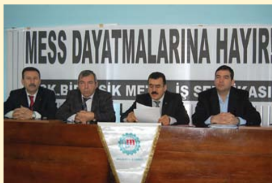
Kocaeli Şb. basın toplantısı