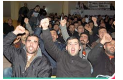
8 Mart'ta Gebze Kapalı Spor Salonu'nda yapılan dayanışma gecemizde binlerce metal işçisinin coşkusu vardı..